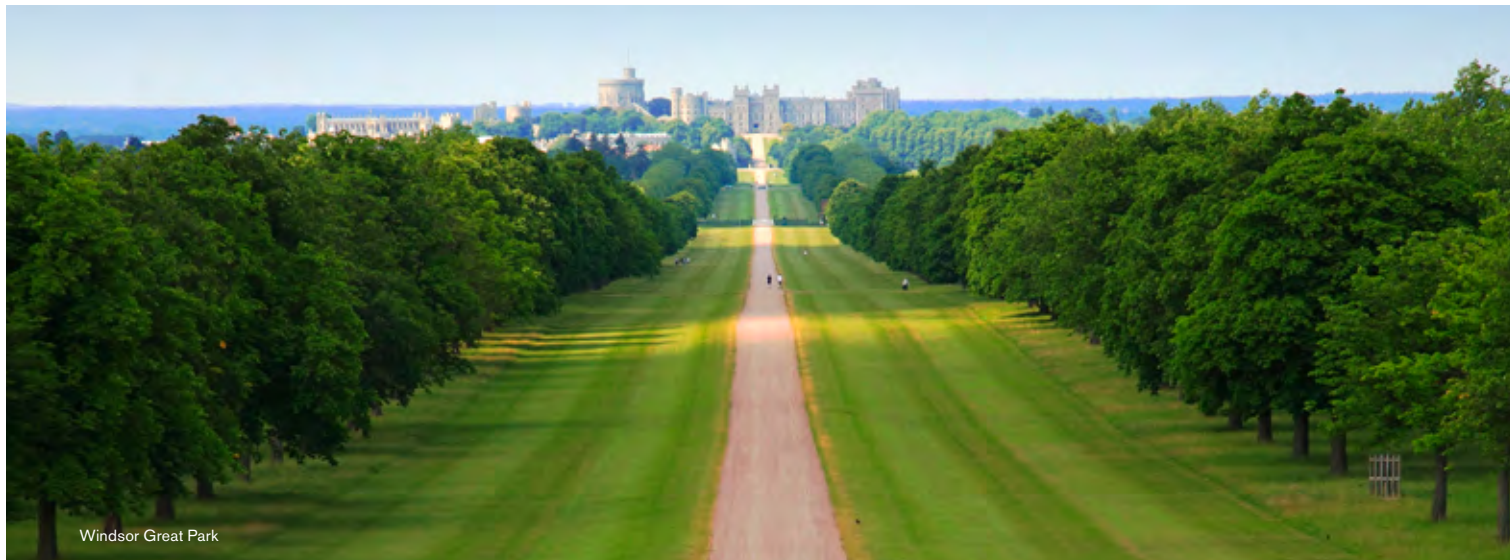
Windsor Great Park