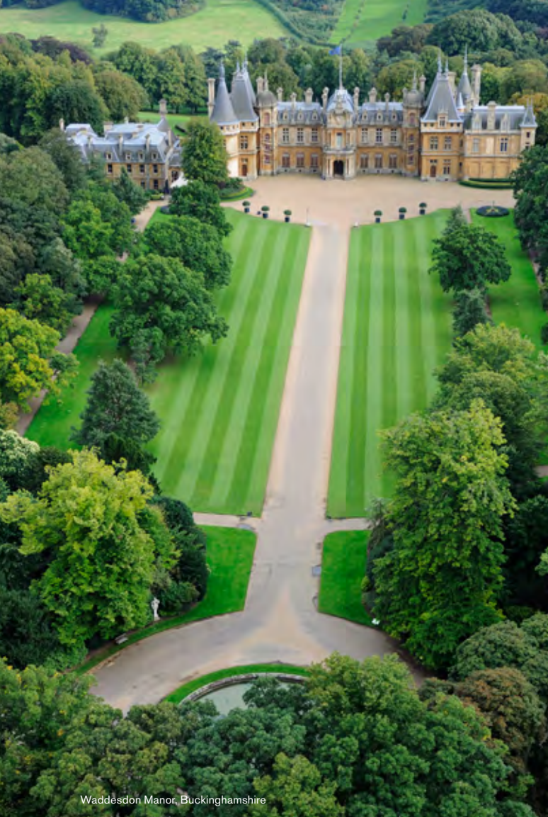
Waddesdon Manor, Buckinghamshire